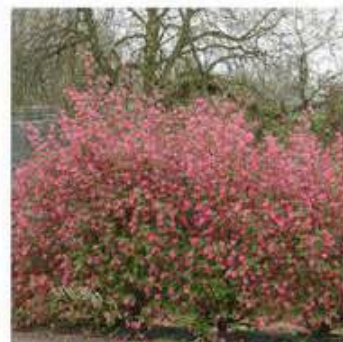
Groseillier à fleurs